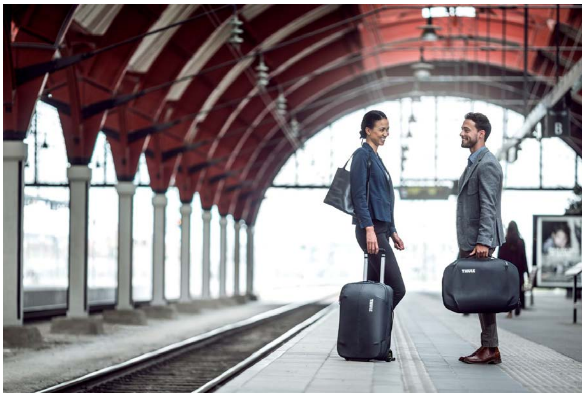
Thule Subterra – en väskserie med 13 väskor i 3 färger för den moderna affärsresenären som kombinerar affärer med nöjesresor, är första steget i koncernens långsiktiga satsning på denna globalt växande kategori.