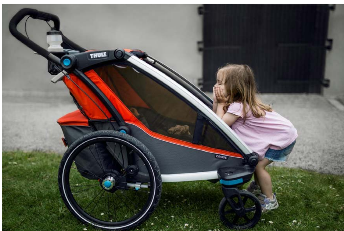
Thule Chariot Sport – med den nya familjen av Thule Chariot multisportvagnar sätter vi en ny standard på konceptet ”1 vagn, 4 aktiviteter” då man smidigt cyklar, går, springer eller åker längdskidor med sina barn. De uppdaterade modellerna har massor av tekniska förbättringar, men också ett modernare designspråk och uppmärksammades bland annat med IF Product Design Gold Award.